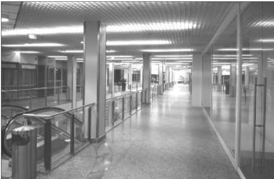
Ein Bild mit Symbolcharakter.