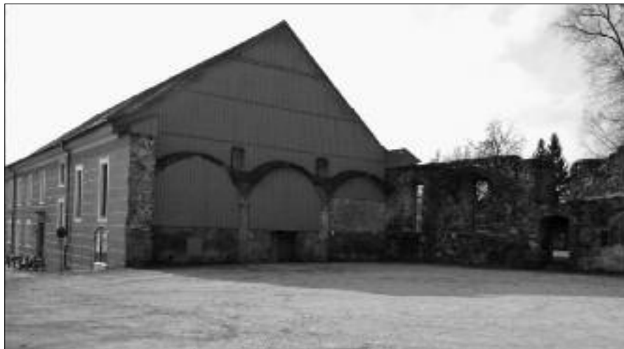
Fürsternbau Hacklberg: Idealer „Leerraum“ für Kultur.

Denn auf die kann Passau nicht verzichten – so die Kulturvertreter. Ihr Konzept: ein zweiter Bau neben der ungeliebten, unausweichlichen Halle soll für die kleine, feine Musik gebaut werden; was dröhnt, möge auch künftig in der Naha bleiben. Wie beide Baukörper zu einer harmonischen Einheit zu verbinden sind, an dieser städtebaulich so markanten Stelle, darüber müssten sich die Architekten den Kopf zerbrechen. ... Geld