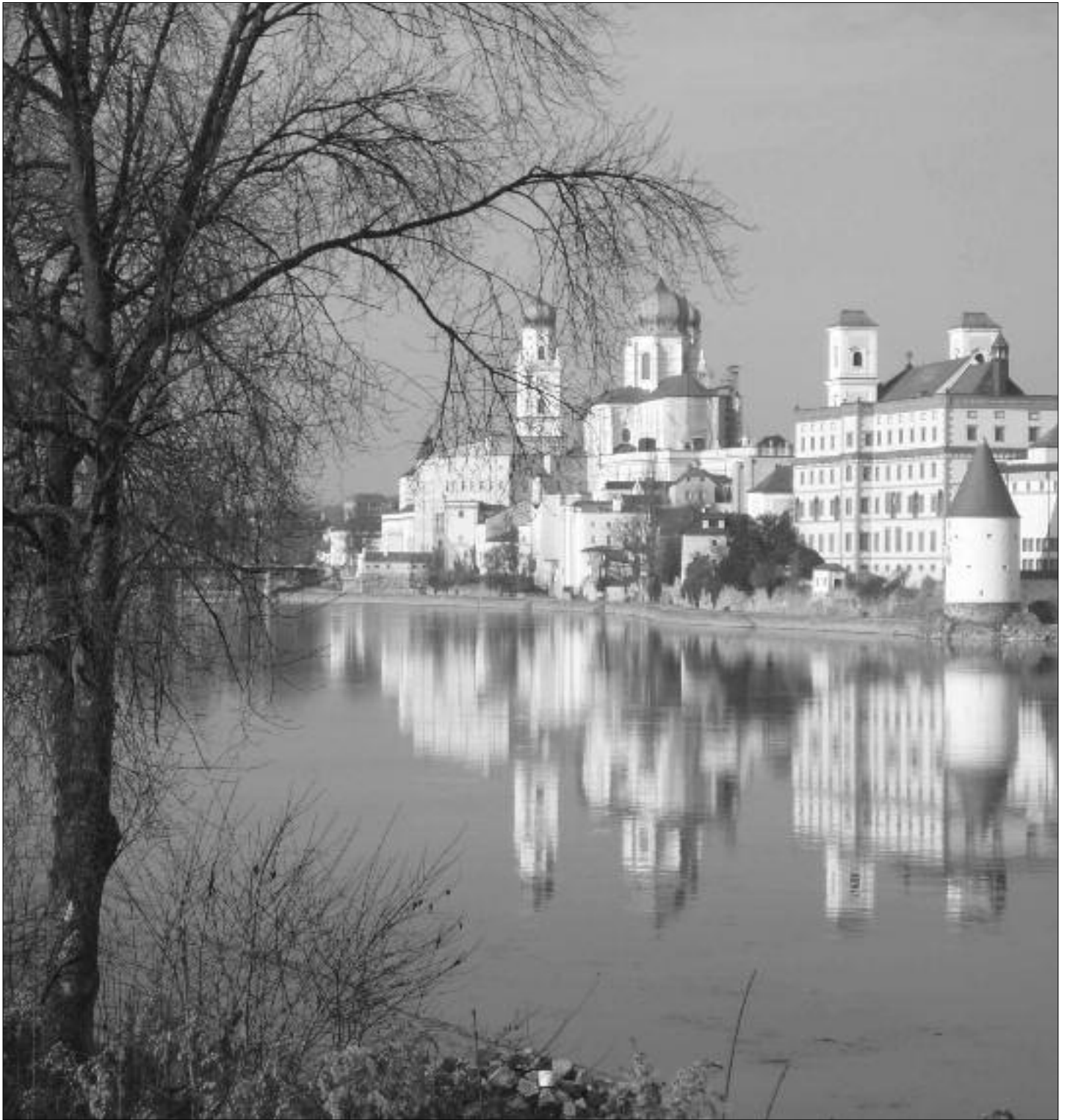
Kein Konzerthaus, kein Geschichtsmuseum, kein Welterbe...aber doch eine gewisse Schönheit.