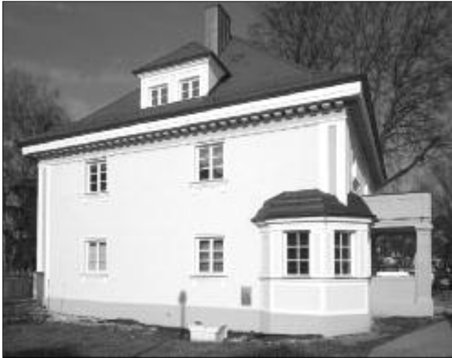
Die Lenk-Villa nach der Sanierung.

Viel Positives gab es im Jahr 2011 nicht zu berichten. Erfreulich ist nur die gelungene Sanierung der „Lenk-Villa“ (Lenk-Porzellan-