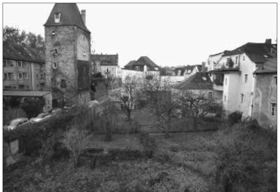
Die bedrohten Gärten in der Römerstraße.